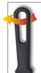
Self-Ventilated Handle Manche ajouré